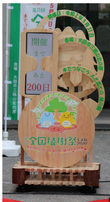
(カウントダウンボード)