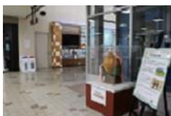
(萩・石見空港での展示)